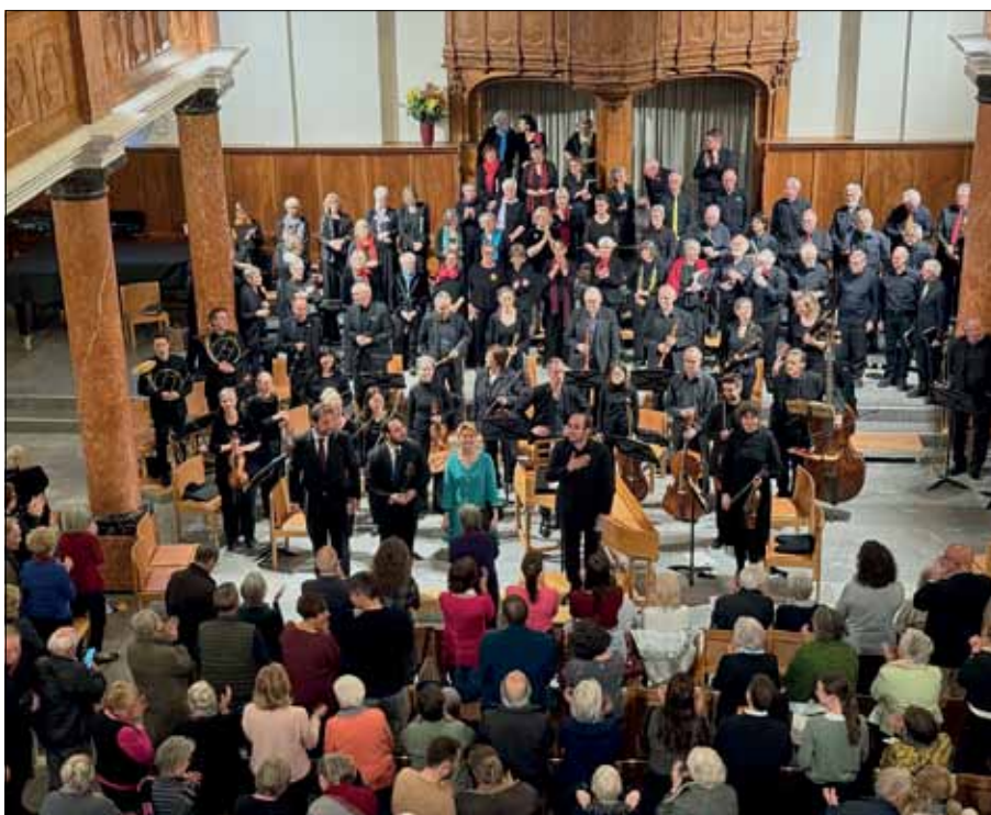
Der Schlosschor beim Jubiläumskonzert in der Kirche St. Peter in Zürich.