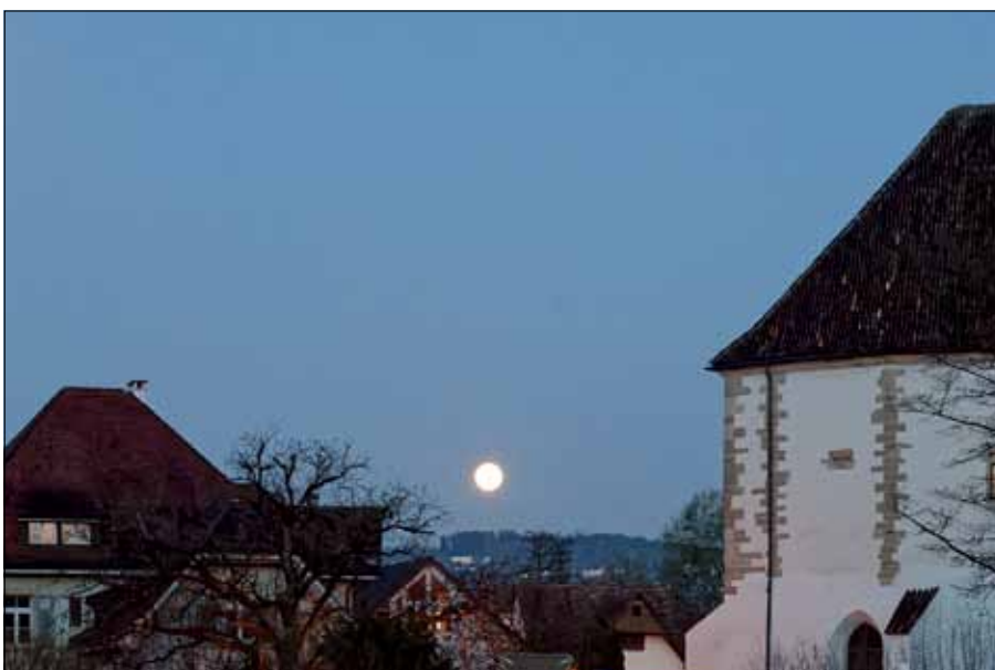
Der Vollmond erhellt das Städtli.

aufgenommen am 3. April im Städtli.