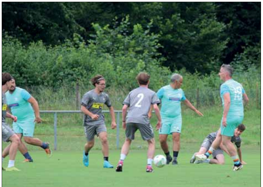
Ein Höhepunkt am Sponsorenlauf waren zweifelsohne die Spiele Junioren gegen Trainer und Eltern.