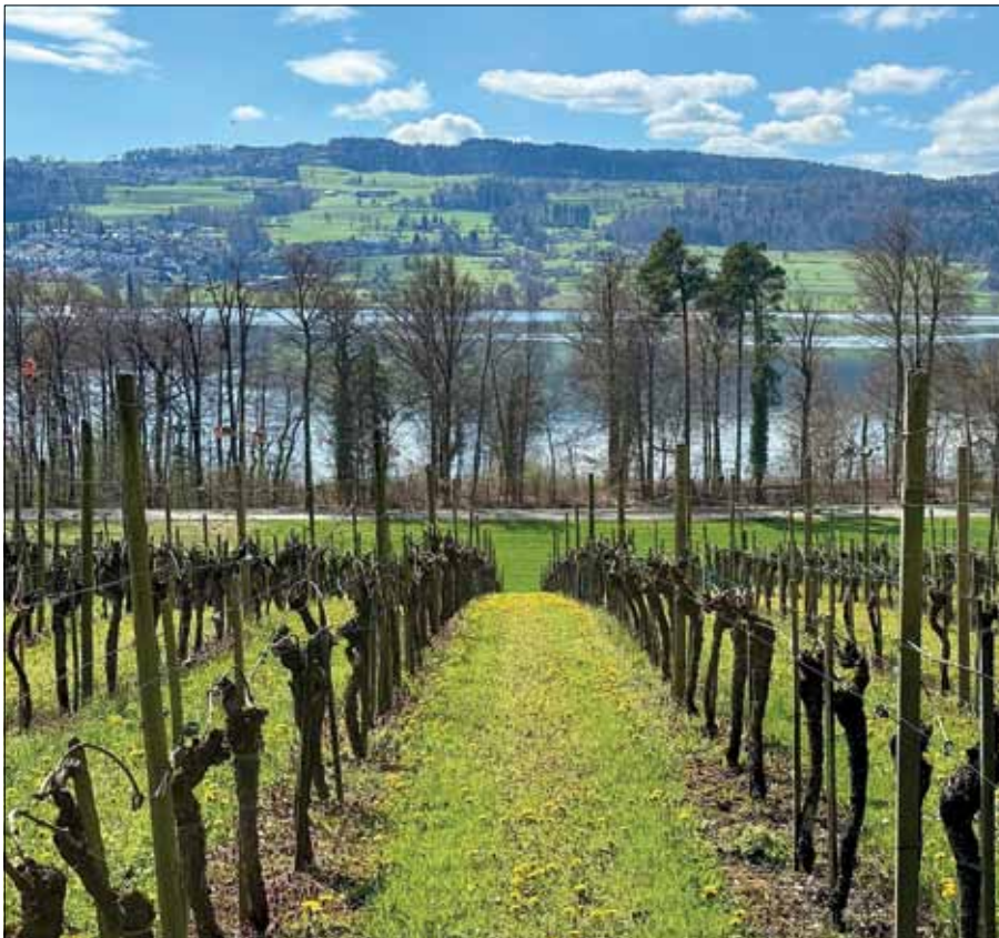
Blick durch den noch schlafenden Rebberg.

Bild: Karin Christen, aufgenommen am 5. April beim Chrottenbüel.