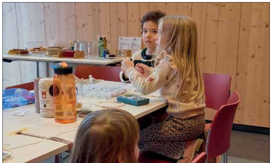
Keiner zu klein, um kreativ zu sein.