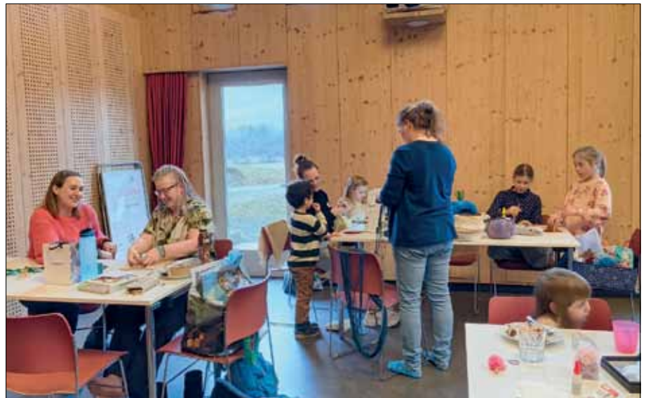
Gesellige und kreative Runde im Klairs.