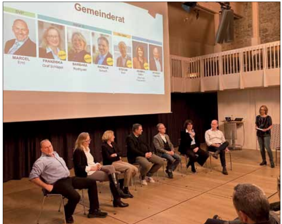
Sieben Kandidatinnen und Kandidaten bewerben sich um die fünf Sitze im Gemeinderat. Im Landenberghaus stellen sie sich den Fragen des Publikums.

Bei den Behördenwahlen am 8. März werden neben Primarschulpflege und Gemeinderat auch die Sozialbehörde, die Rechnungsprüfungskommission und die Kirchenpflege neu bestellt. Nicht neu gewählt wird hingegen die Oberstufen-